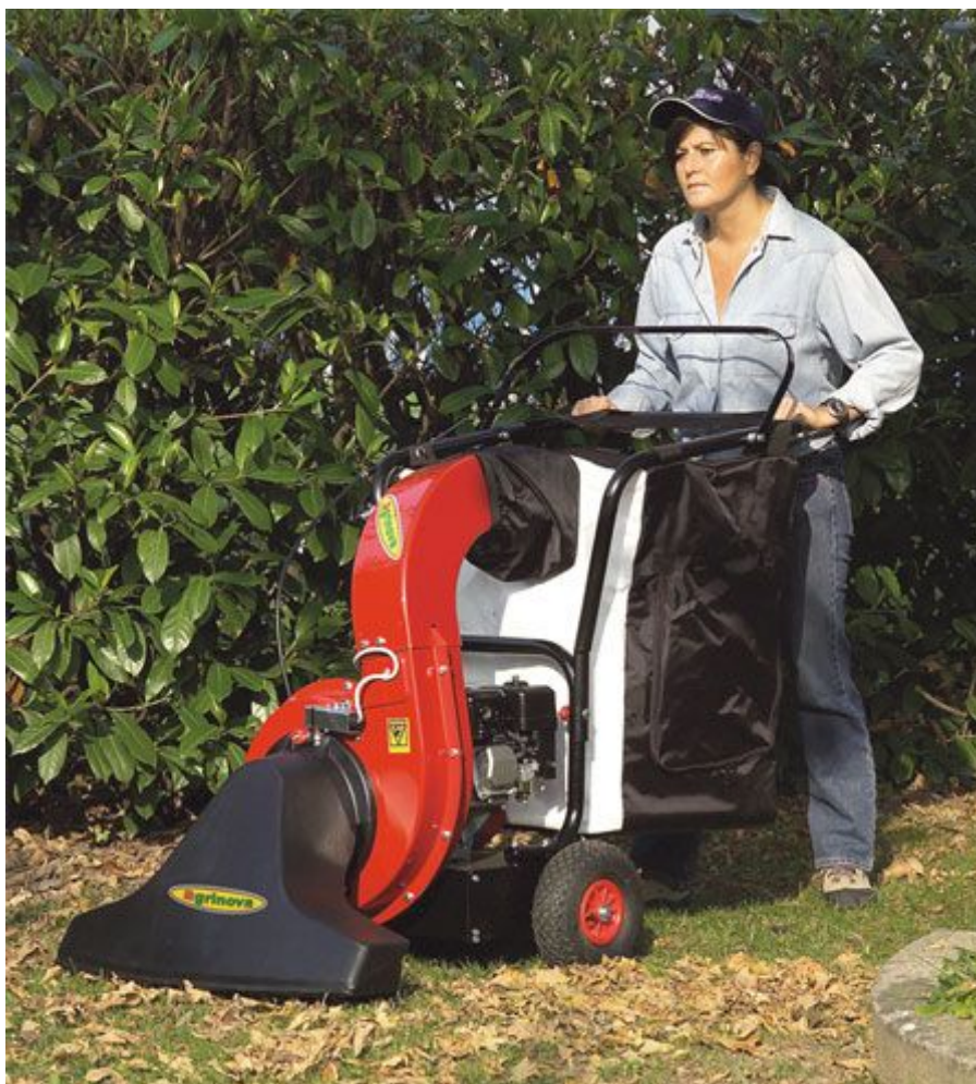
Utilaje profesionale de aspirat /refulat

Compania noastra va ajuta in alegerea echipamentelor si utilajelor optime necesare activitatilor Dvs, fie ca acestea sunt destinate curateniei, gradinei, constructiilor, printr-un serviciu de consiliere pe care vi-l oferim gratuit. Pentru a raspunde cerintelor clientilor nostri intr-un timp cat mai scurt personalul de service a urmat cursuri intensive de specializare si training pe produs direct la producator. In acest moment se poate asigura service on site la orice locatie in Bucuresti in maxim 24 ore si in tara in maxim 48 ore, nemaifiind necesara transportarea utilajului.